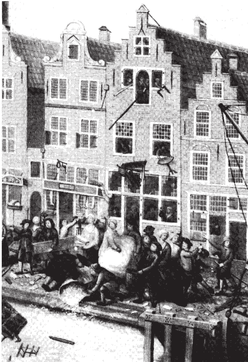
afb. 2. Detail uit afb. 1.