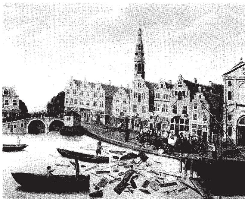
afb. 1. Plundering van het huis "De drie haringen" door Pieter Cattel, 1748. Doek, 59 x 77 cm. Leiden, Stedelijk Museum de Lakenhal.

huis is tijdens de plundering onbewoond, op een paar dienstboden na, die hun toevlucht op een zolderkamer zoeken. Zij worden door enige studenten gered. Eén van de plundersaars van dit huis is de schilder Johannes Korthals 10 die, volgens een ooggetuige, alles vernielde waaraan hij tevoren met schilderen en lakken veel geld verdiend had. Aan de verwoesting die meer dan vier uur duurt en gedeeltelijk bij kaarslicht wordt uitgevoerd, wordt een einde gemaakt door de komst van een groep soldaten. Zij kondigen hun komst aan door met los kruit te schieten. De soldaten weten een paar plundersaars, waaronder de zoon van Korthals, gevangen te nemen. Eén van hen heeft een kamisool en f 1 00,- en wordt daarom verhoord. Maar onder druk van de burgers, die op wacht staan, wordt ook deze man weer vrijgelaten.